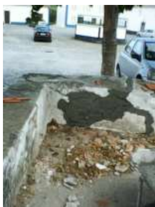
Reparação de muro no Largo de Santo António em A da Gorda