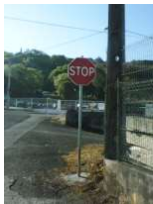
Reposição de sinalização – Área da Freguesia