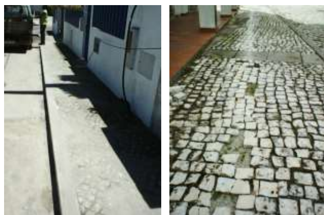
Manutenção e reparação de passeios – Carregal e Senhor da Pedra