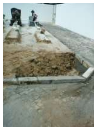
Pequenos melhoramentos no Cemitério de Santa Maria