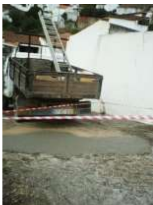
Cimentação de rotura na Rua das Curvas – Sobral da Lagoa