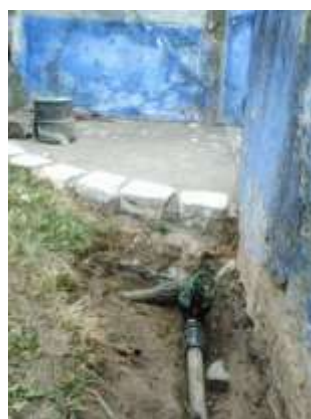
Manutenção e reparação das regas automáticas na área da freguesia