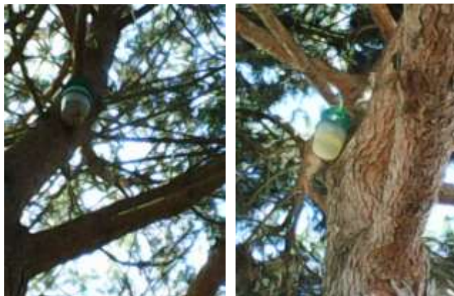
Colocação de armadilhas para a lagarta do pinheiro – área da freguesia