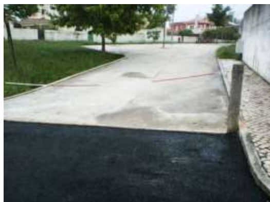
Colocação de corrente no Parque Infantil do Senhor da Pedra