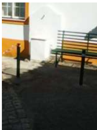
Colocação de pinos junto à Igreja – Arelho