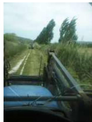
Trituração de Bemas e Caminhos Rurais – Área da Freguesia