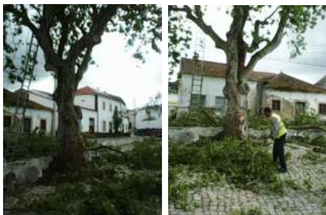
Desbaste de árvores no Largo de Santo António em A da Gorda