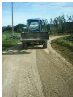
Manutenção de Caminhos Rurais – Área da Freguesia