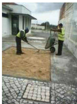
Substituição das caixas de areia nos Jardins de Infância da área da freguesia