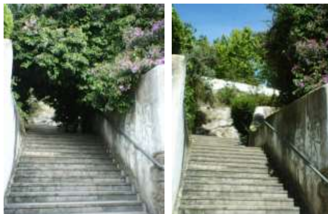
Desbaste de árvores em Óbidos