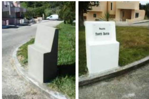
Construção de muretes e colocação de placas toponímicas – área da freguesia