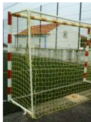
Colocação de redes de baliza no campo de futebol – Sobral da Lagoa