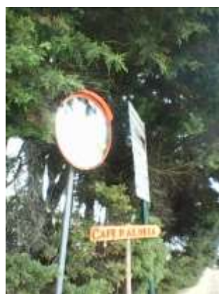
Substituição de espelho no cruzamento em Trás do Outeiro