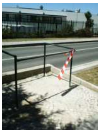
Colocação de proteções para os contentores – Área da Freguesia