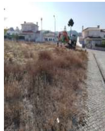
Início dos Trabalhos de Requalificação da Praceta dos Arneiros (Lavadouros) - Pinhal