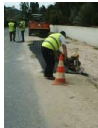
Aplicação de Massas Asfálticas – Área da Freguesia