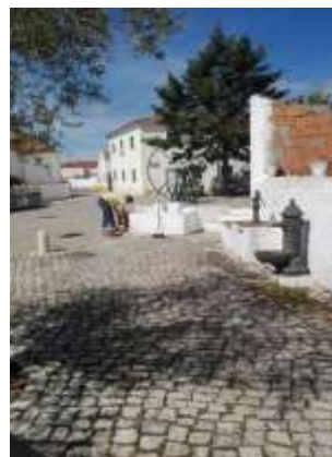
Caiação de Espaços Públicos - Pinhal