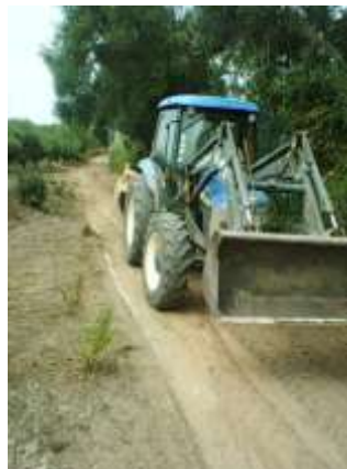
Manutenção de Caminhos Rurais – Área da Freguesia