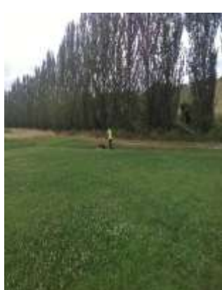
Corte de Relvas e Manutenção de Espaços Verdes – Área da Freguesia