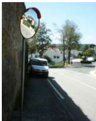
Colocação de Sinalização de Trânsito – Área da Freguesia