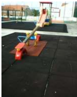
Manutenção de Espaços de Lazer – Área da Freguesia