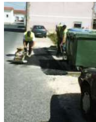
Aplicação de massas asfálticas na área da freguesia