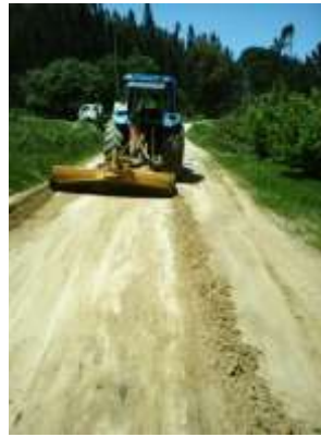
Manutenção de Caminhos Rurais – área da freguesia