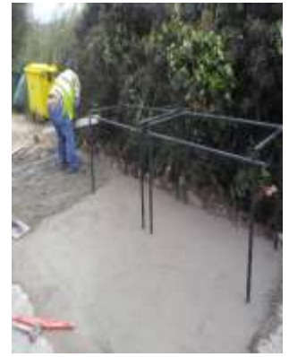
Construção de Bases e colocação de proteções para Contentores – Arelho e Casal da Toiça