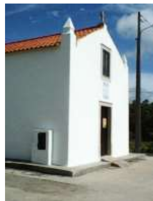
Colaboração Pintura da Capela de Santo António – Casais da Navalha