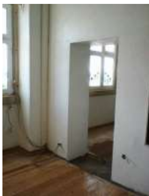
Abertura de Porta na Antiga Escola Primária do Sobral da Lagoa