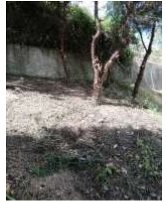
Início da Limpeza e Corte de Árvores na Antiga Escola Primária de Óbidos