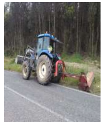
Roça e Trituração – Área da Freguesia