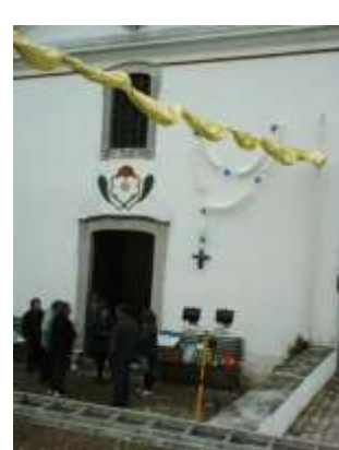
Apoio na Receção da Imagem Peregrina de Nossa Senhora de Fátima – Área da Freguesia