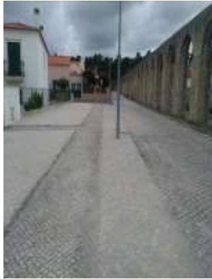
Calçetamento no Bairro dos Arcos