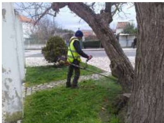
Cortes de relva – área da freguesia