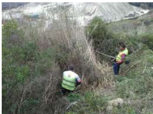
Desmatção de terrenos