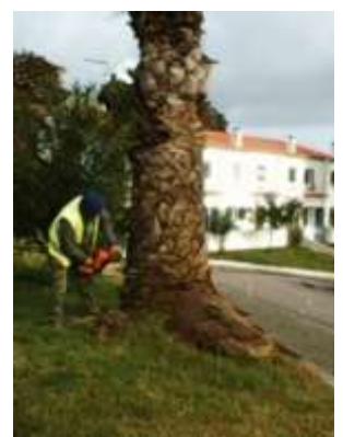
Corte de árvores na área da freguesia