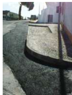
Aplicação de massas asfálticas na área da freguesia