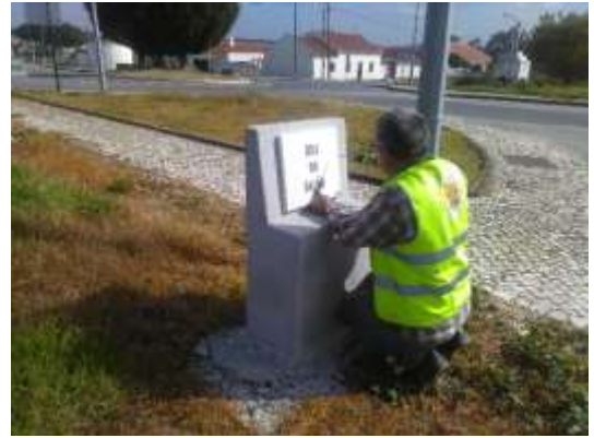
Construção de muretes e colocação de placas toponímicas – área da freguesia