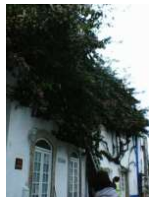
Limpeza e manutenção de espaços verdes da Vila de Óbidos