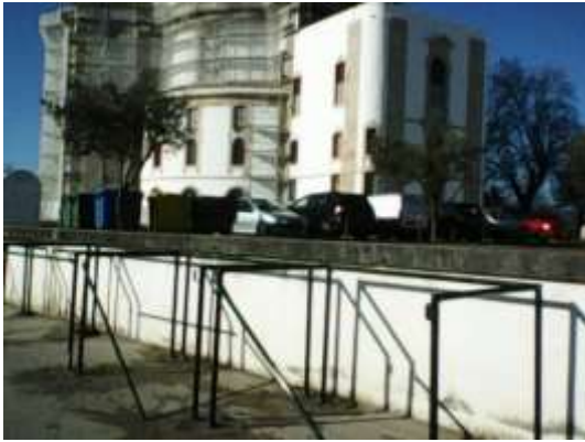
Continuação da construção de bases e colocação de proteções para os contentores – área da freguesia