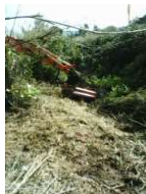
Roça e trituração de estradas e regueiras – área da freguesia