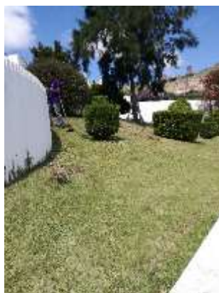
Colocação do sistema de rega nos jardins dos Arrabaldes em Óbidos