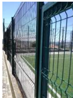
Reparação geral do gradeamento do campo de futebol sintético do Sobral da Lagoa