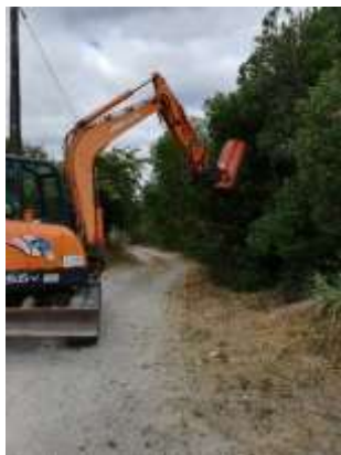
Trituração e limpeza de valas área da freguesia