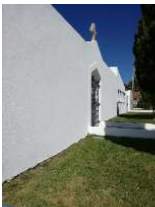
Pintura geral do Cemitério do Sobral da Lagoa