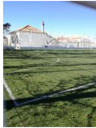
Reparação geral do gradeamento do campo de futebol sintético de A da Gorda