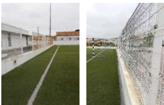
Reparação geral do gradeamento do campo de futebol sintético do Arelho