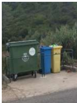
Início do corte de ervas dentro das localidades na área da freguesia e limpeza das bases dos contentores