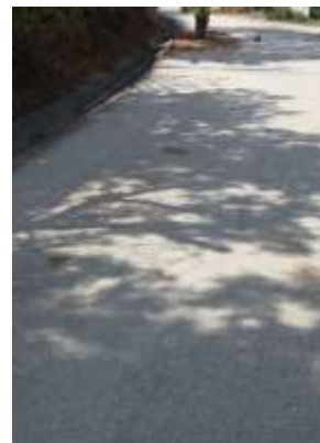
Colocação de massas frias na área da freguesia