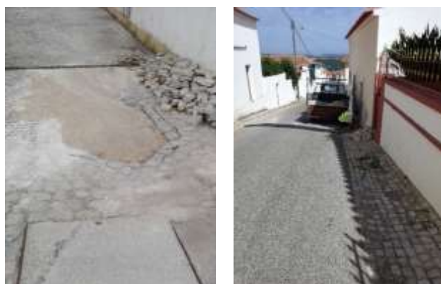
Pequenas reparações de calçada na área da freguesia