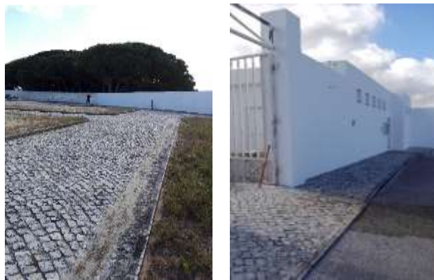
Pintura geral do Cemitério de Santa Maria