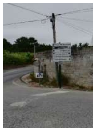
Uniformização da sinalética na área da freguesia