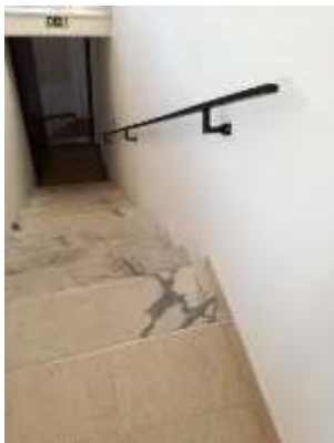
Pequenas reparações e adaptações na delegação da junta de freguesia no Sobral da Lagoa