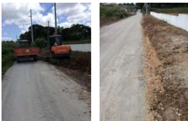
Alargamento parcial da Estrada da Serrada – Bairro da Senhora da Luz