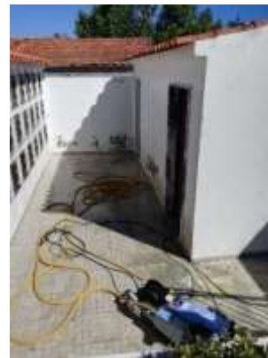
Início dos trabalhos de preparação para a pintura do Cemitério do Sobral da Lagoa