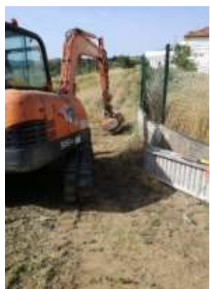
Trituração de caminhos rurais na área da freguesia