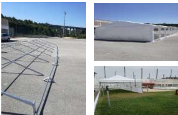
Montagem de tendas para eventos dentro e fora da área da freguesia