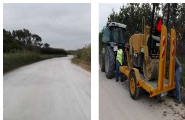
Manutenção dos caminhos rurais na área da freguesia