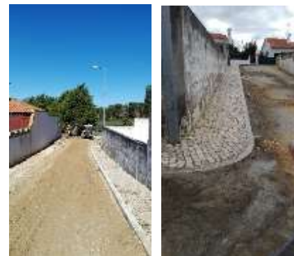
Arranjo de estrada e construção de passeio no Senhor da Pedra