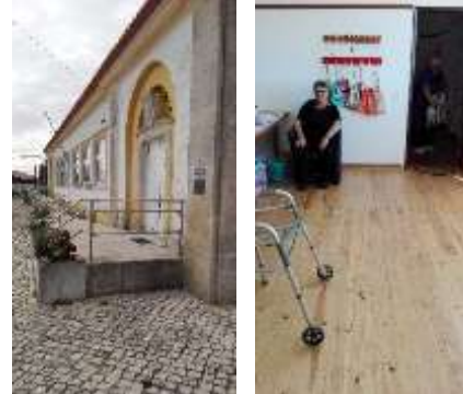
Reparação do piso no Centro de Convívio do Sobral da Lagoa