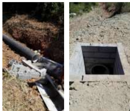
Construção de caixas fluviais – área da freguesia