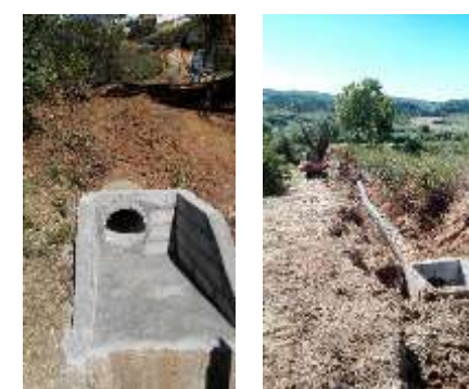
Entubagem das águas fluviais no Carreiro das Oliveiras – Sobral da Lagoa