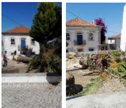
Corte de palmeira e de cedro no largo da igreja no Sobral da Lagoa