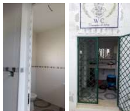
Colocação de instalação elétrica nas casas de banho públicas do Sobral da Lagoa