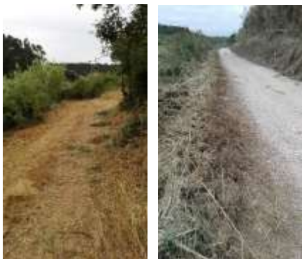
Roça e trituração de caminhos rurais – área da freguesia