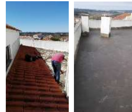
Isolamento do terraço da associação do Sobral da Lagoa