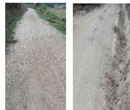
Manutenção de caminhos rurais e abertura de valetas – área da freguesia