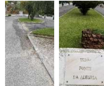
Colocação do sistema de rega automática na Urbanização Fonte da Alegria - Pinhal