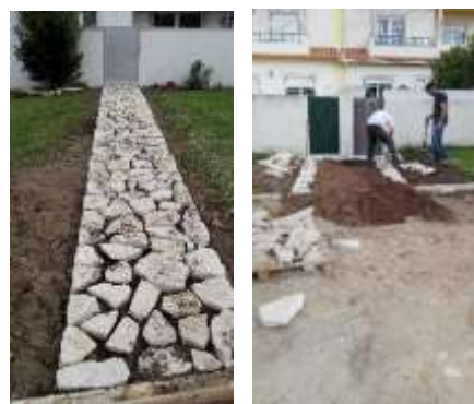
Continuação da requalificação do parque infantil e zonas circundantes no Senhor da Pedra