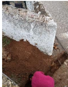
Ligação da rede de esgoto na casa de banho da capela de Trás do Outeiro