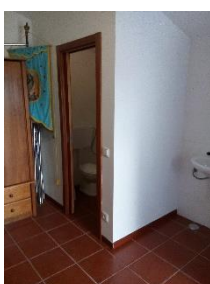
Construção de uma casa de banho na capela de Trás do Outeiro