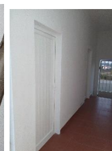
Substituição das portas exteriores no cemitério de Santa Maria