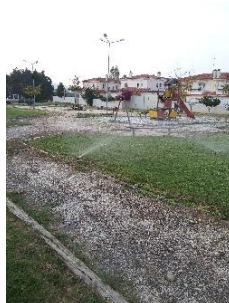
Colocação de um sistema de rega automático – Parque Infantil do Senhor da Pedra