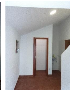
Construção de uma casa de banho na capela do Sobral da Lagoa