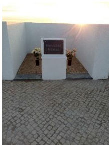
Conclusão dos ossários gerais dos cemitérios da freguesia