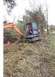
Desassoreamento de valas na área da freguesia