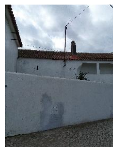
Ligação da rede de esgoto e água na casa de banho da capela do Sobral da Lagoa