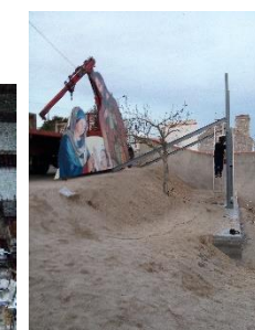
Construção do Presépio Panorâmico no Sobral da Lagoa