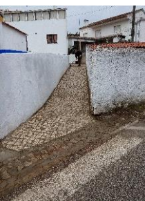
Calçetamento da travessa junto à capela de Trás do Outeiro e conservação dos muros envolventes