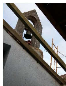
Reparação de uma parte do telhado da capela do Sobral da Lagoa