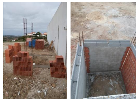
Construção do Ossário geral – Cemitério Sobral da Lagoa