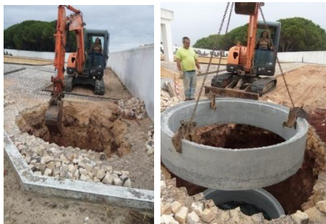
Construção do Ossário geral – Cemitério de Santa Maria