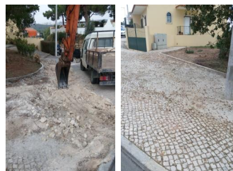
Reconstrução de largo em calçada – Quinta da Pegada