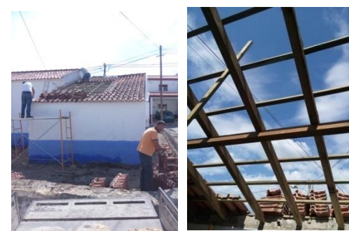
Reparação do telhado da sacristia da Igreja de Trás do Outeiro