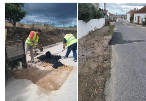
Colocação de massas frias – área da freguesia