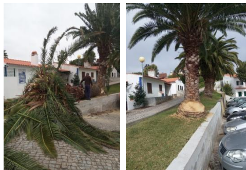
Corte de palmeiras no Moinho da Canastra