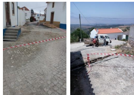
Recuperação de calçadas e colocação de grelhas – Sobral da Lagoa