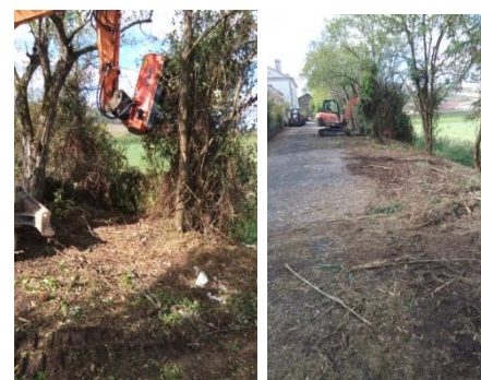
Roça e trituração da Rua da Estação – Óbidos