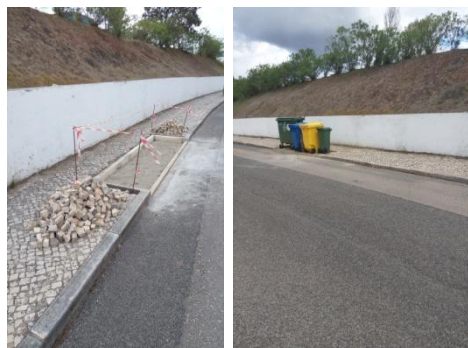
Continuação da construção de bases para os contentores