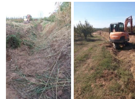
Desassoreamento da vala no Novo Mundo – A da Gorda