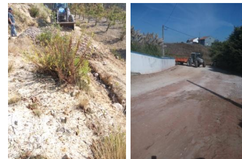
Manutenção de caminhos rurais – Área da freguesia