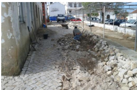
Reconstrução da calçada no Largo de Santo António – A da Gorda