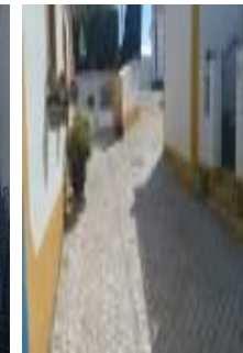
Lavagem da Rua Américo Venâncio