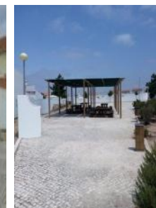
Construção de um parque de merendas no Bairro dos Arcos - Óbidos