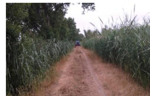
Manutenção da ecopista e outros caminhos rurais