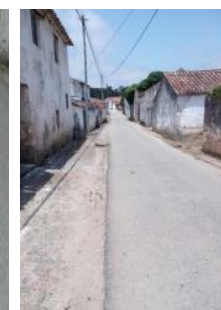
Construção de grelha e limpeza intensa das valetas – Trás do Outeiro