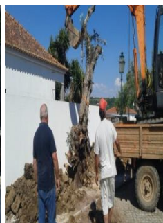
Deslocação de oliveira do Pinhal para o Senhor da Pedra