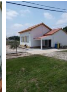
Construção de um telheiro na antiga escola primária – Bairro da Senhora da Luz