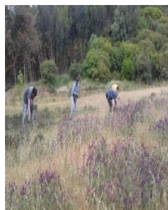
Colaboração na apanha dos “Maios”