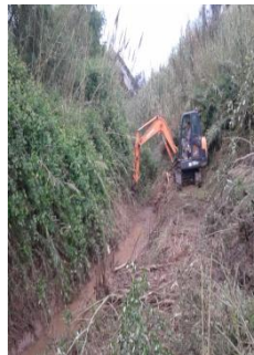
Limpeza da vala na Aboboriz – A da Gorda