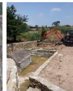
Continuação dos trabalhos na fonte do Carregal