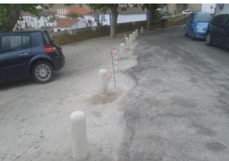
Colocação de pinos na Serra de Cima – Óbidos