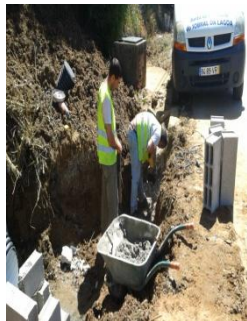
Ligação à caixa de águas fluviais na Antiga Estrada Real – A da Gorda