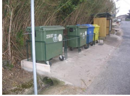
Construção e aplicação de armações para os contentores do lixo