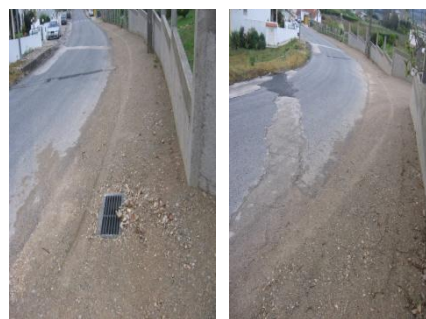
Alargamento da berma na Estrada da Capeleira