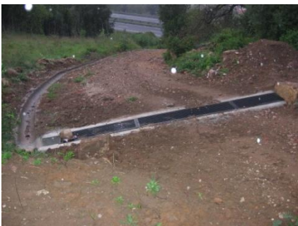
Colocação de ½ manilhas e grelha e reparação da estrada no Casal da Serra, Capeleira