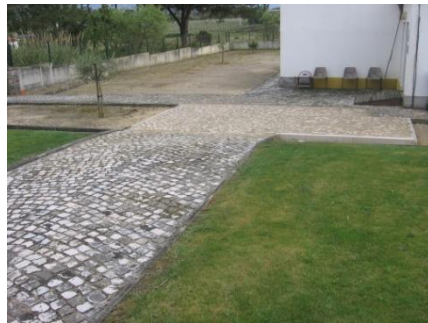
Colocação de calçada junto ao átrio da antiga escola primária – Bairro Sra. Luz