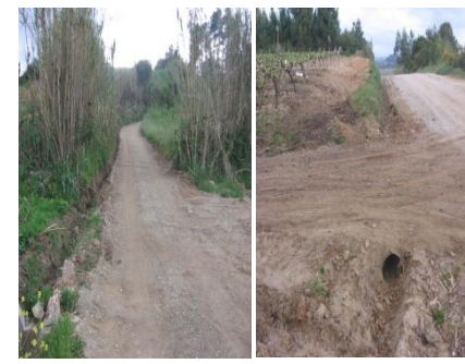
Abertura de valetas e reparação na Estrada da Charneca - Arelho