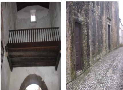
Pequenas reparações e limpeza do Oratório Nossa Senhora da Graça - Óbidos