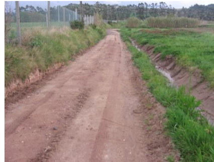
Abertura de valetas e colocação de drenos - Carregal