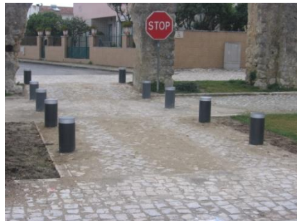
Calçetamento e colocação de pinos de proteção na passagem do aqueduto – Bairro dos Arcos