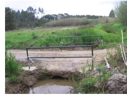
Colocação de corrimões na ponte da Estrada de Santiago – Bairro da Senhora da Luz