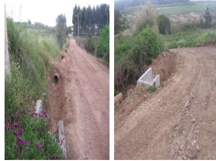
Limpeza de manilhas e abertura de valetas na Estrada da Alameda - Arelho