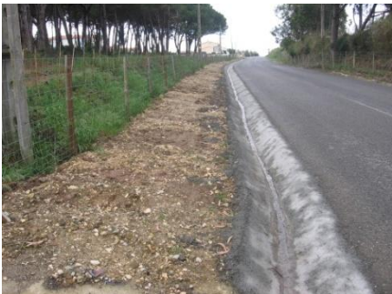
Reconstrução da valeta com colocação de betão na Estrada Sra. da Luz, Avarela