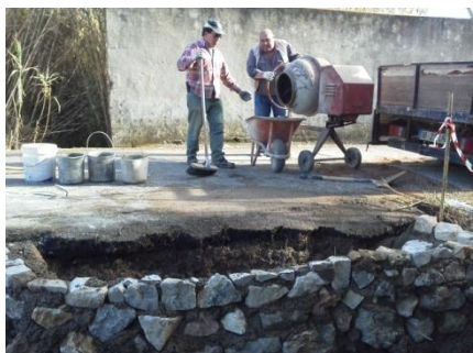
Construção de um paredão na Rua das Pombas em A da Gorda