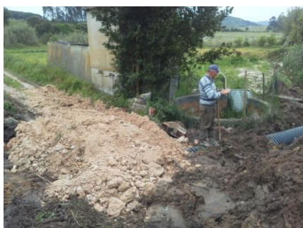
Construção de caixa de água e manilhamento na Rua do Vale no Carregal