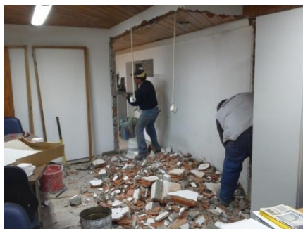
Alteração da sede da Junta de Freguesia