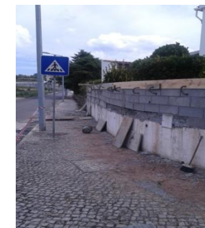
Reconstrução de paredão na Rua Fundadores do Pinhal