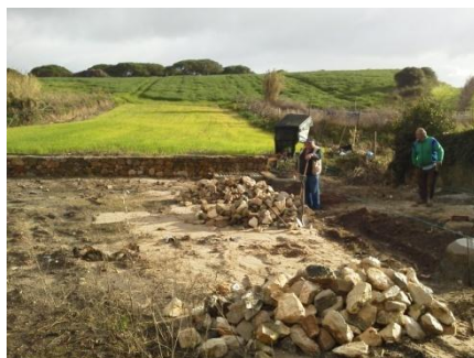
Continuação da obra da fonte do Carregal