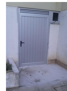
Abertura de uma porta exterior para a casa de resíduos no Centro de Saúde de Óbidos