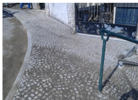
Rebaixamento de calçada na Rua Descida dos Moinhos no Sobral da Lagoa