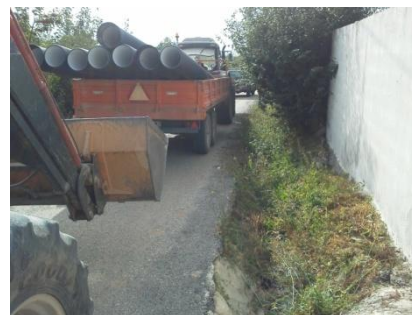
Manilhamento no Casal dos Pedros