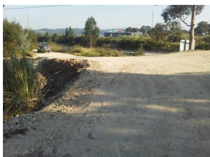
Alteração da serventia na Rua da Figueira no Casal da Toiça