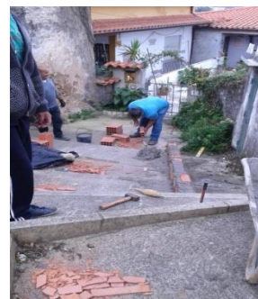
Construção de rampa para a passagem de cadeiras de rodas no Sobral da Lagoa