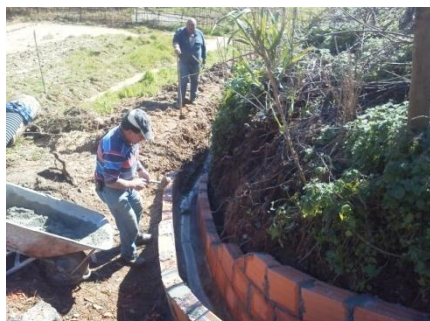
Construção de caixas de água e manilhamento na Rua Trás da Roda no Arelho